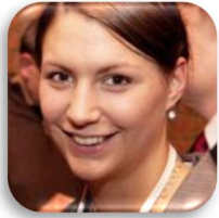
Cornelia Daniel Marketing & PR

Für Kooperationen, Medienpartnerschaften und Sponsoring nutzen Sie bitte nachfolgende Kontaktmöglichkeiten mit dem WeissSee Team.